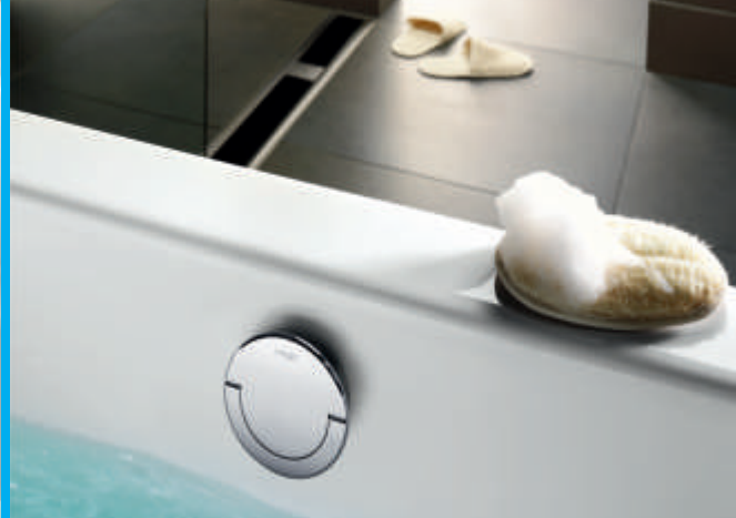
3. ábra: Dizájn és klikk működtetésű leeresztőszelepek