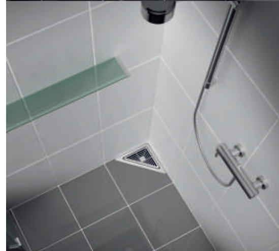
9. ábra: Sarok zuhanylefolyók, negyedköríves és háromszög kialakítás