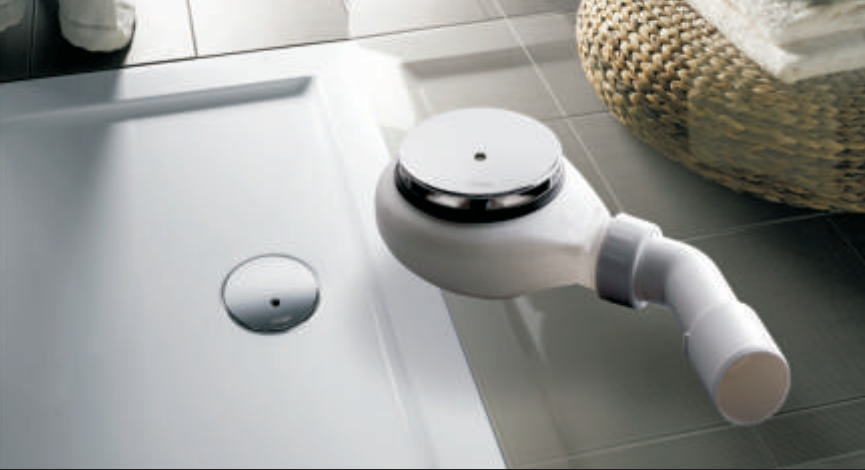
5. ábra: Csak 60 mm magas, de öblös kialakítása magasabb vízvezetést tesz lehetővé a felújításoknál, utólagos kiépítéseknél is.