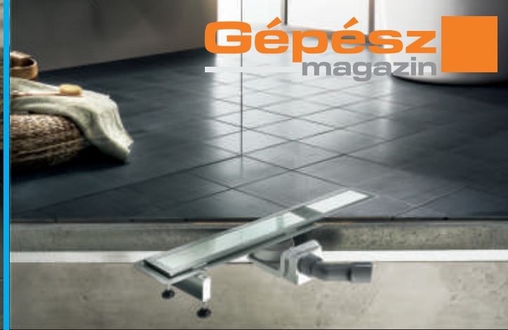
7. ábra: "Korrekt" zuhanylefolyórács, magasságban biztonsággal állítható, szigeteléshez szakszerűen illeszthető

kiemelős változatok mellett megjelentek itt is az esztétikus, ill. a kézzel működtetett, klikkes változatok. (3. ábra)