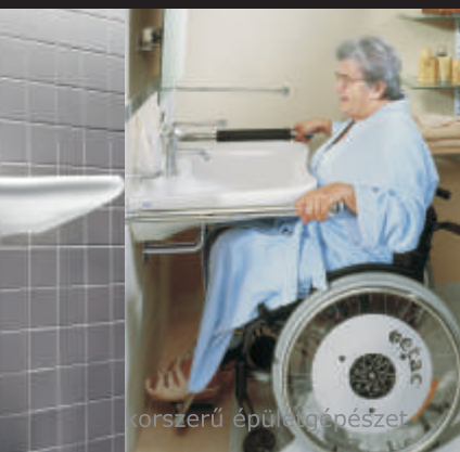
4. ábra: Helytakarékos szifon, mozgássérült mosdó