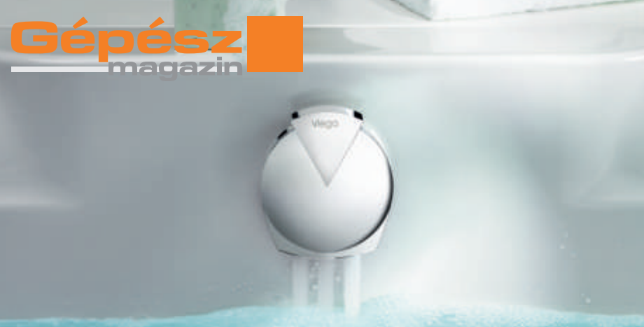
1. ábra: Multiplex Trio: kád le-, túl- és befolyó, három az egyben funkció különböző dizájn működtetőikkel